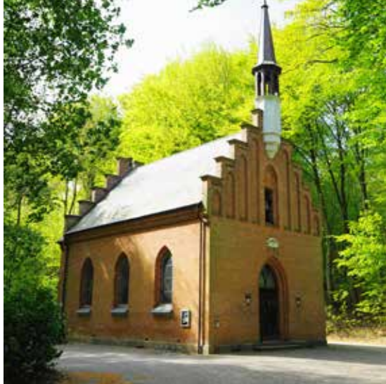
Langesø Skovkapel.