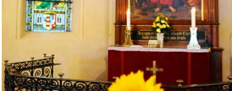
Alteret med solsikke i Langesø Skovkapel.