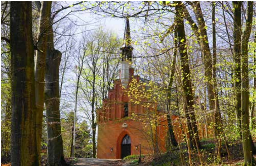
Langesø Skovkapel.